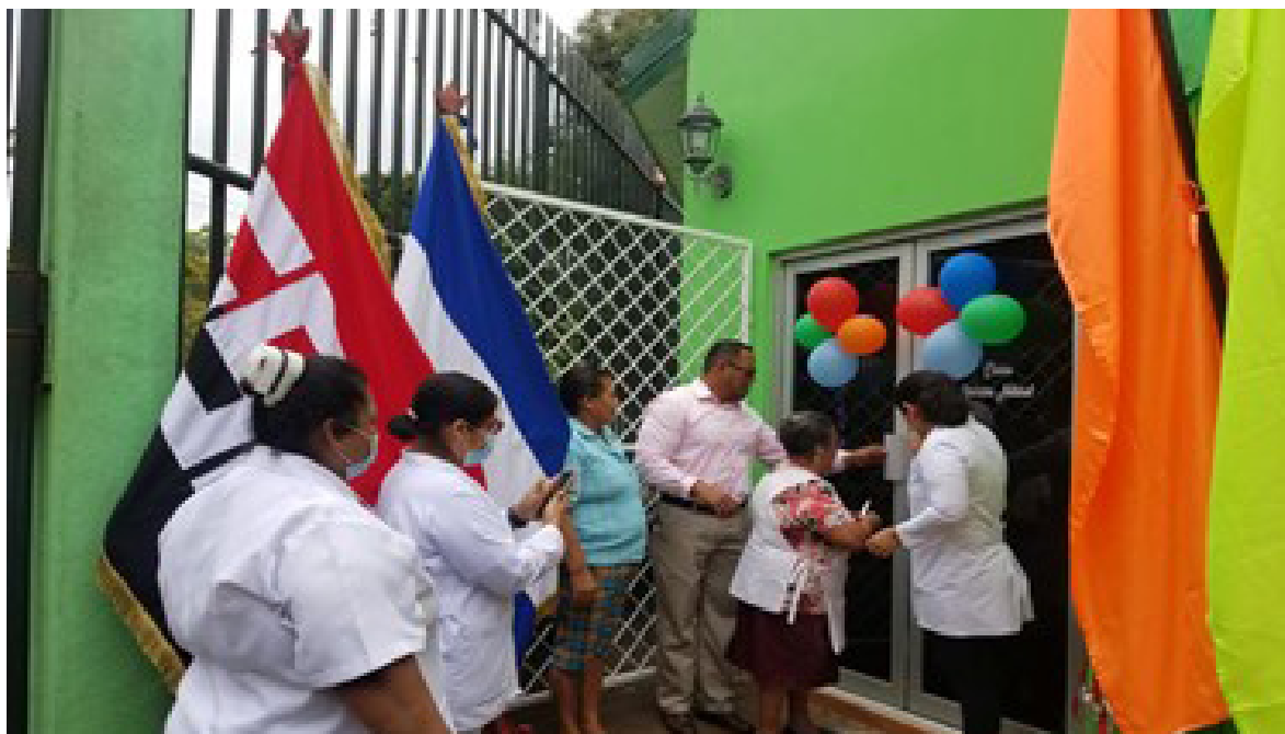
Imagen No. 7. Personal del Estado participando en inauguración de obra pública con símbolos partidarios.