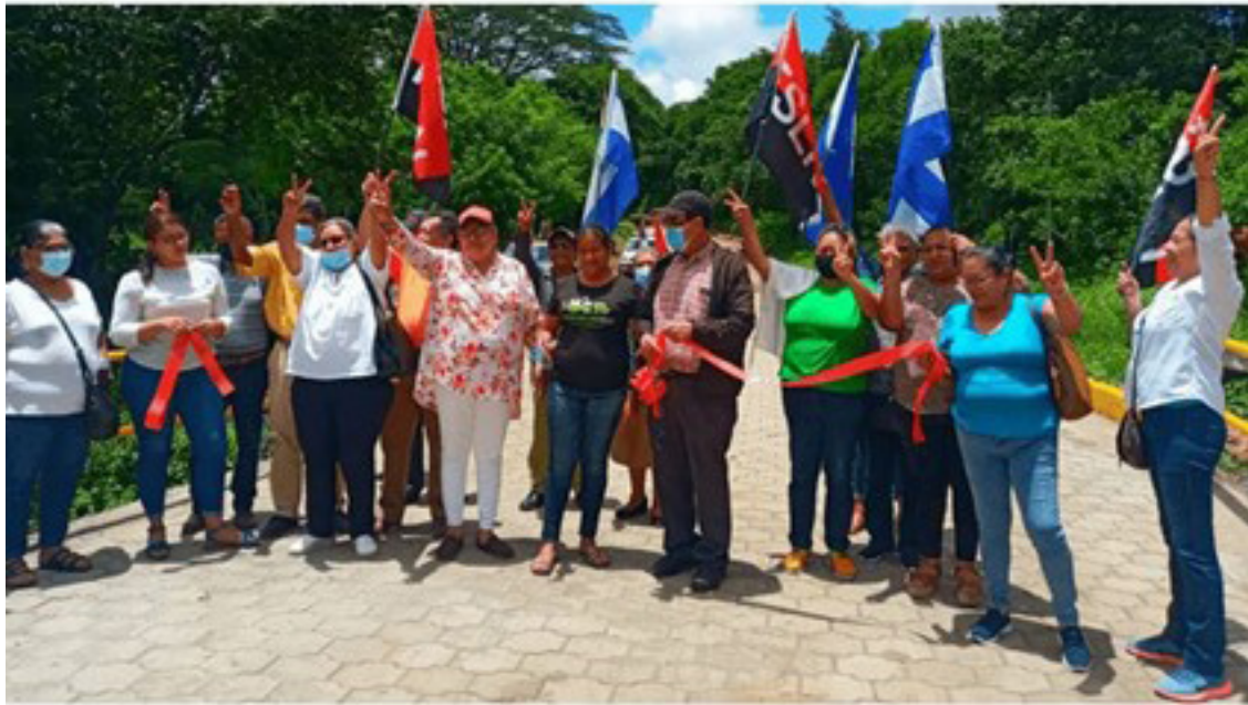
Imagen No. 3. Realización de actos partidarios en la inauguración de proyecto de mejoramiento de infraestructura vial.