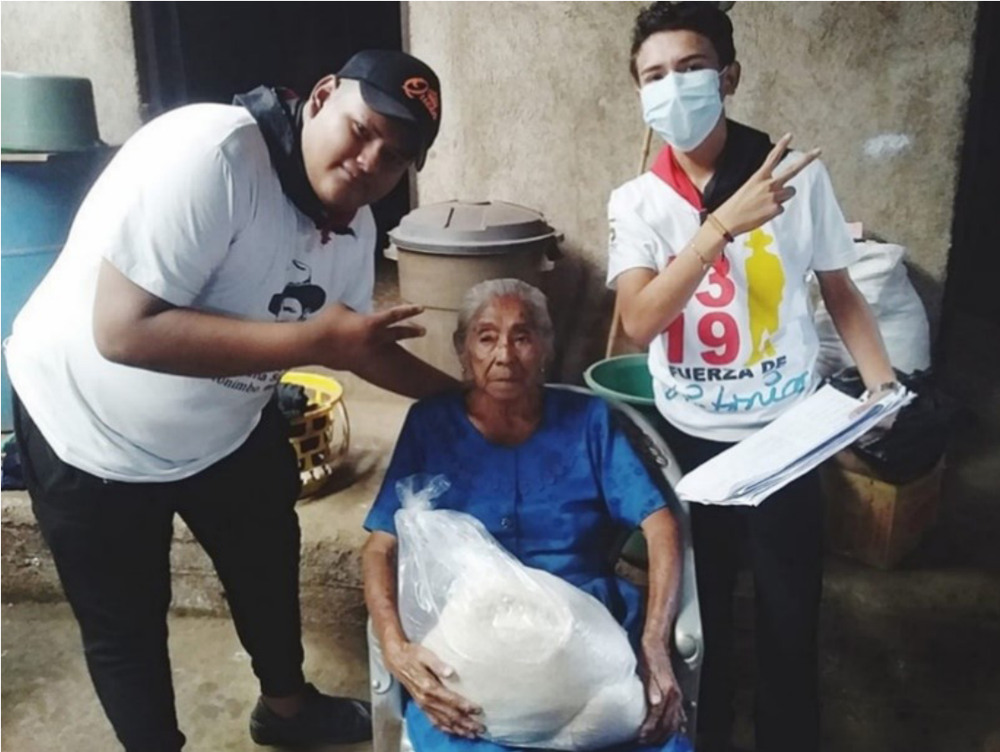
Imagen No. 1. Entrega de ayudas alimenticias en Catarina con presencia de la Juventud Sandinista.