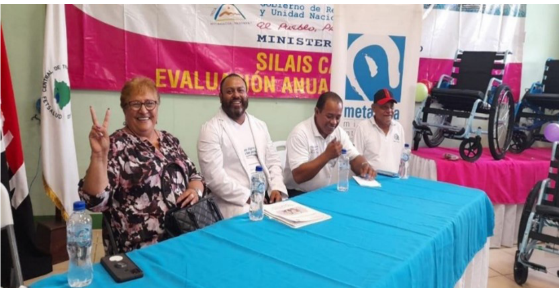
Imagen No. 2. Politización en entrega de sillas de ruedas a personas discapacitadas.