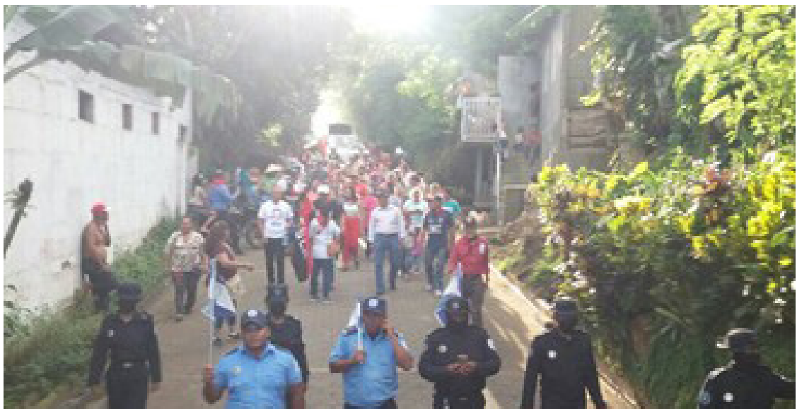
Imagen No. 4. Participación de policías uniformados en actos partidarios.