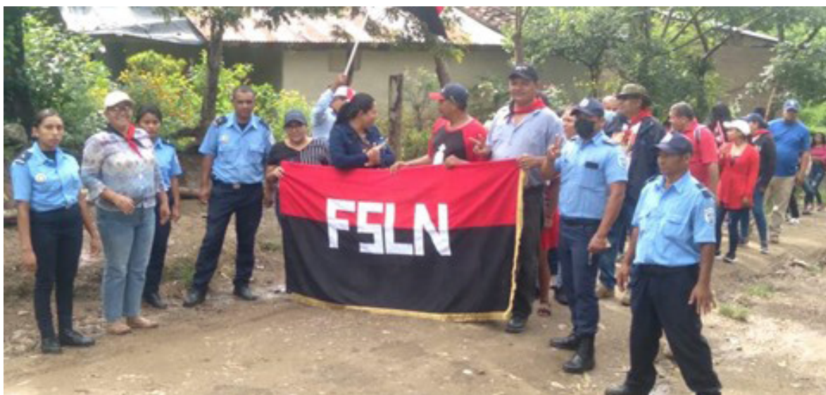
Imagen No. 6. Personal del Estado participando en actividades partidarias.