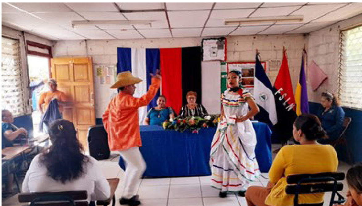
Imagen No. 5. Presentaciones de planes de gobierno local de las y los candidatos del FSLN.