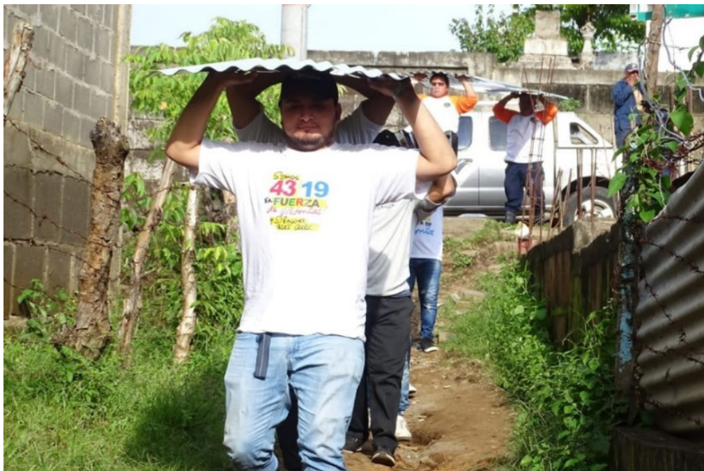
Imagen No. 9. Juventud Sandinista entregando ayuda humanitaria tras paso de Huracán Julia.