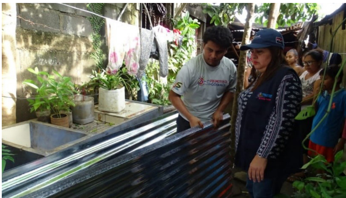
Imagen No. 8. Juventud Sandinista entregando ayuda humanitaria tras paso de Huracán Julia.